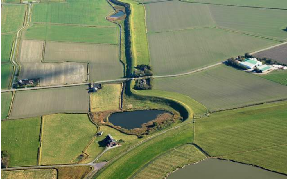
Abbildung 5: Ockholmer Koog and Sönke-Nissen-Koog