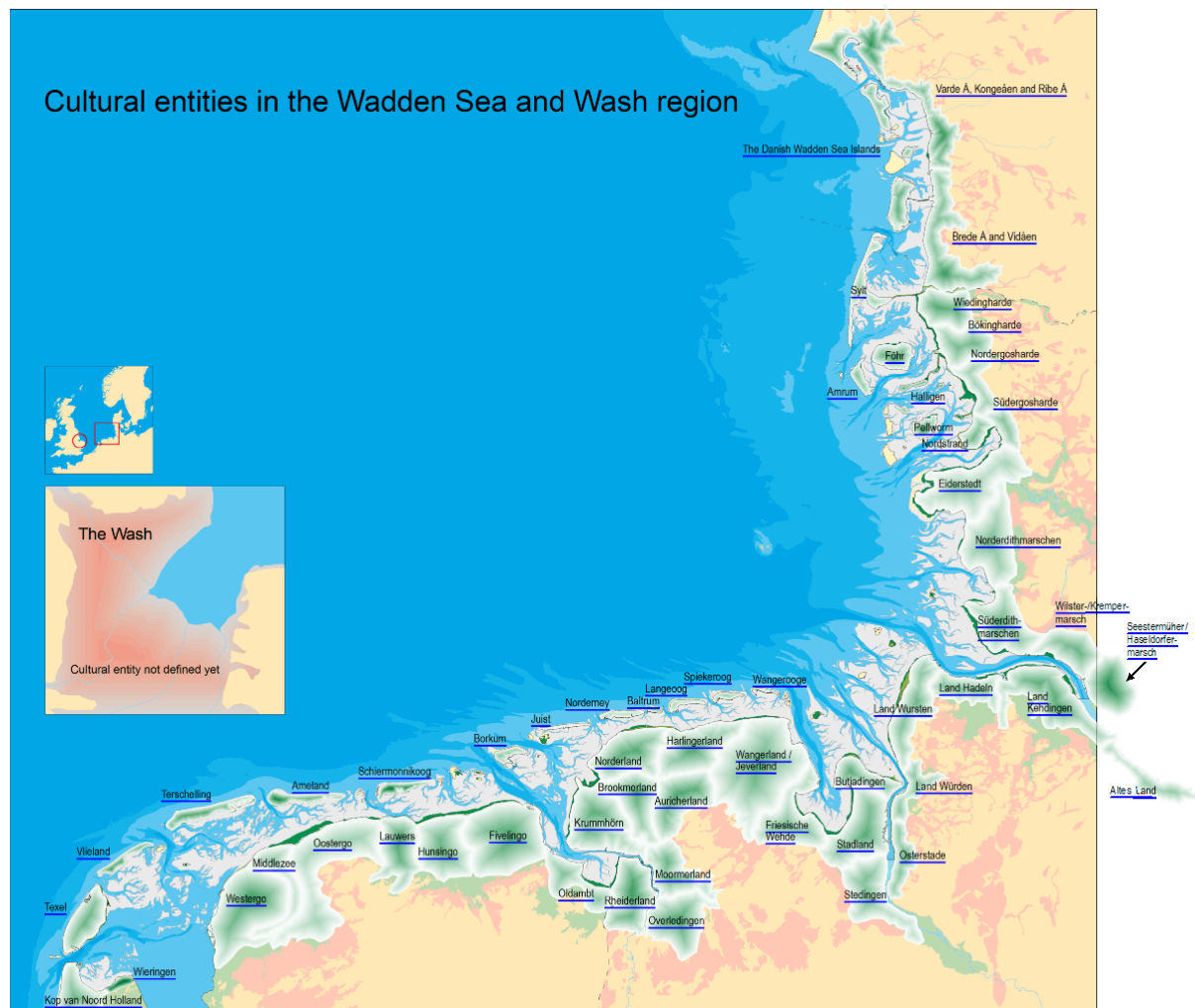
Abbildung 2: Karte der beschriebenen kulturellen Einheiten in der Wattenmeerregion

Die Vielfalt des kulturellen Erbes ist das Ergebnis historischer Interaktion zwischen menschlicher Aktivität und einer sich wandelnden Umwelt. Das Kulturerbe ist eine zentrale Quelle modernen Lebens. Es hat einen starken Einfluss auf die Identität und den Bürgerstolz der Menschen. Seine andauernde physische und mentale Präsenz tragen entscheidend zum Charakter und Ortssinn/Gespür für ländliche und städtische Milieus bei. In der Wattenmeerregion ist diese Quelle reich, komplex und unersetzlich, sie hat großes Potenzial sowohl im Hinblick auf den ihr inwohnenden Wert als auch ihre Rolle in der wirtschaftlichen Entwicklung.