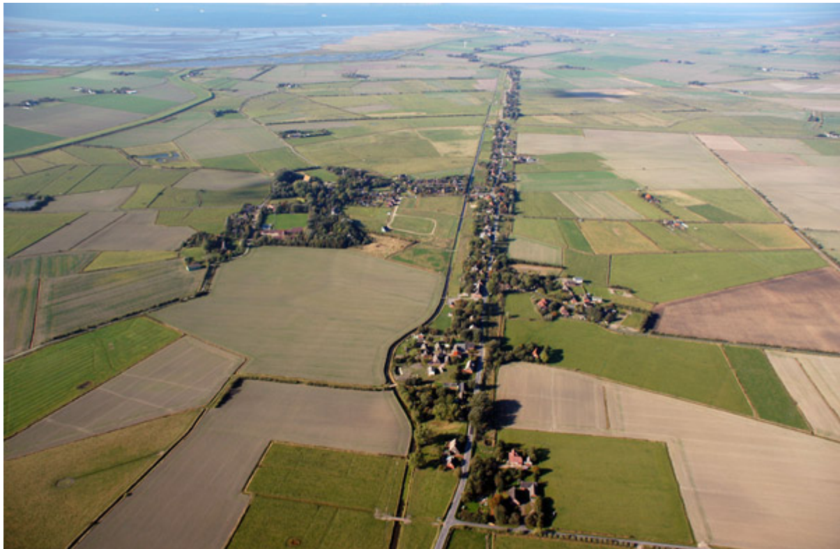
Abbildung 6: Fahretoft-Hollaenderdeich

„best practice“ Beispiele zu vergrößern und mit einander zu teilen, und weiterhin das Bewusstsein über einem einmaligen Erbgut zu steigern. Deshalb gibt es einen Bedarf, die Zusammenarbeit innerhalb der gesamten Region auch grenzübergreifend fortzusetzen.